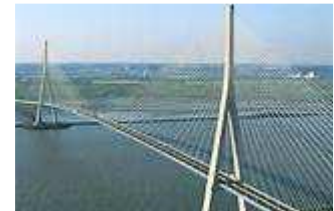
Le pont de Normandie

http://www.technologie.ac-versailles.fr/spip.php?article250