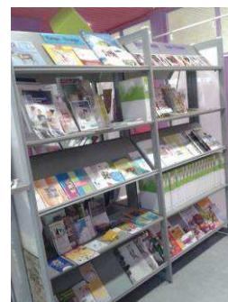
PIJ de la Brenne (36)