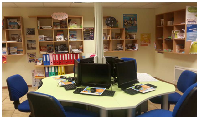
PIJ d'Ingré (45)

Afin d'améliorer ses connaissances et compétences professionnelles, l'informateur. trice jeunesse bénéficie ensuite de modules réguliers de formation continue , délivrés par le CRIJ et ses partenaires.