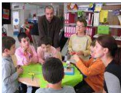
BIJ d'Indre et Loire à Tours (37)