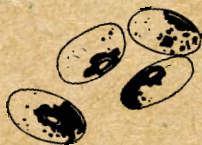
Haricots de Chevilly