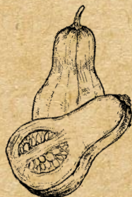
Courge Sucrine du Berry