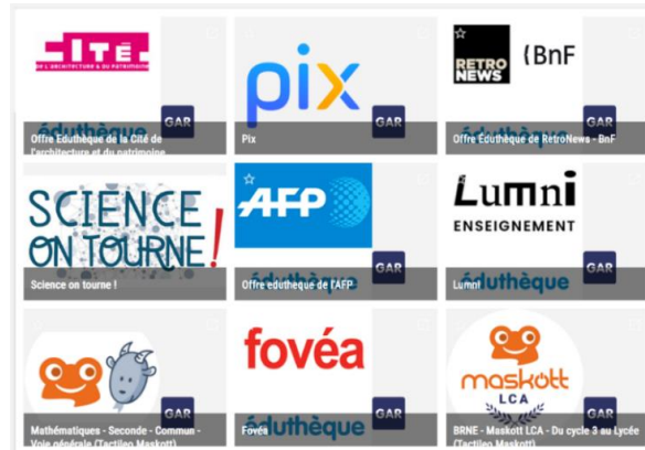
Exemples de ressources dans le Médiacentre

Le Médiacentre permet aux élèves et aux enseignants d'accéder aux bouquets de ressources numériques proposés par les éditeurs sur Internet.