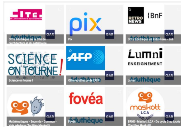
Exemples de ressources dans le Médiacentre

Le Médiacentre permet aux élèves et aux enseignants d'accéder aux bouquets de ressources numériques proposés par les éditeurs sur Internet.