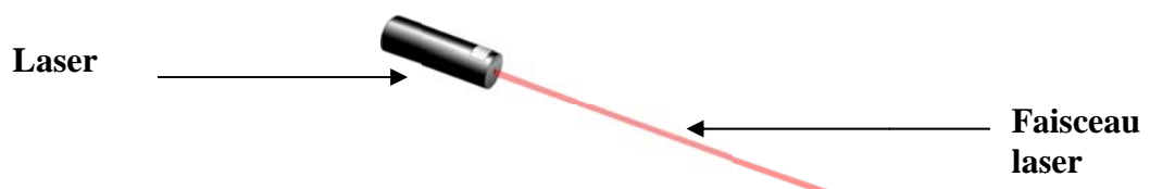
Schéma d'un laser émettant un faisceau lumineux.

Restaurateur utilisant un laser: http://pierres-info.fr