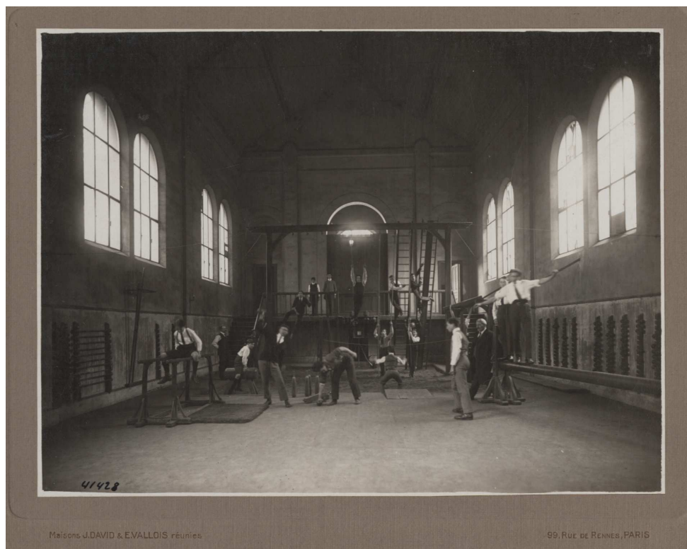
Archives départementales d'Eure-et-Loir, Archives de l'Association des Anciens Elèves du lycée Marceau. 59 J 551

Service éducatif des archives départementales d'Eure-et-Loir