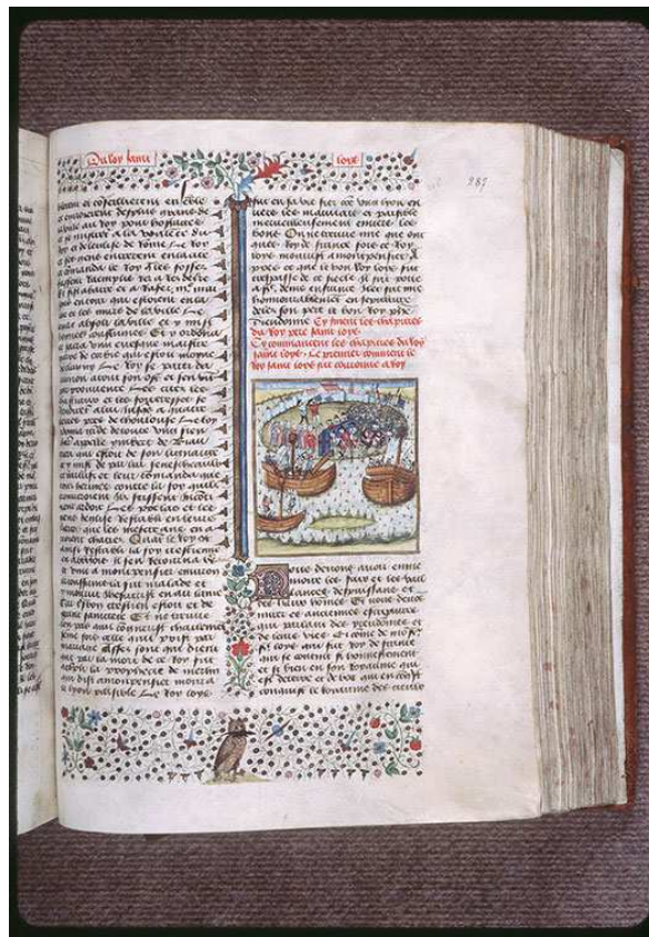
Châteauroux, Bibliothèque Municipale (BM), manuscrit (ms) 005, folio (fol.) 287 : embarquement du cercueil de Saint Louis à Tunis lors de la VIIIème croisade (1270), miniature attribuée au Maître de Marguerite d'Orléans, tirée des Grandes Chroniques de France .

http://www2.culture.gouv.fr/Wave/savimage/enlumine/irht2/IRHT_054384-p.jpg