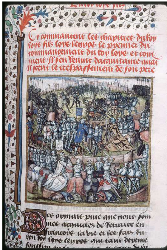
Châteauroux, BM, ms 005, fol.214, le siège de Damas (1148) lors de la deuxième croisade (1147-1149).

http://www2.culture.gouv.fr/Wave/savimage/enlumine/irht2/IRHT_054374-p.jpg