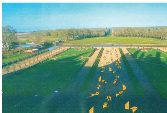
Projet pour Chambord, Nouvelles sculptures dans le jardin à la française