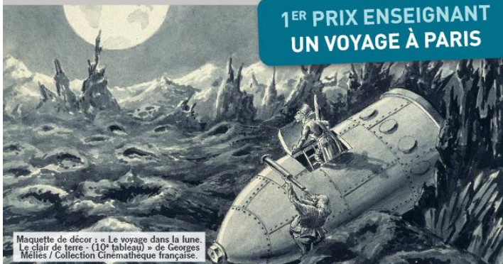
Maquette de décor « Le voyage dans la lune. Le clair de terre » (10 e tableautin) de Georges Méliès / Collection Cinéma française.

« Et lorsque tout sera aplani, l'impossible enfin sur Terre, la lune dans mes mains, alors, peut-être, moi-même, je serai transformé et le monde avec moi, alors enfin les hommes ne mourront pas et ils seront heureux. »