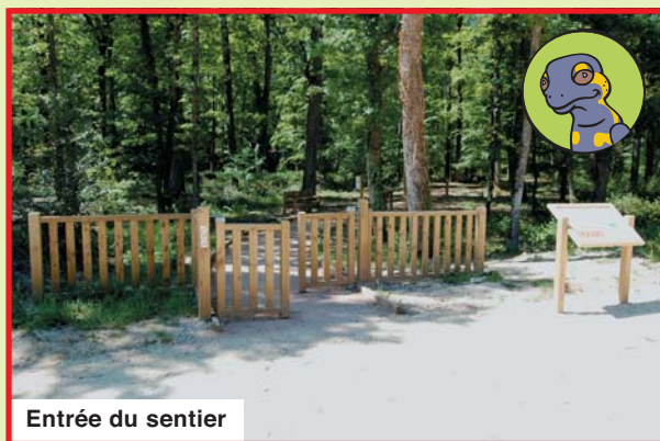
Entrée du sentier

Le Conseil Général du Cher participe au financement de l'animation