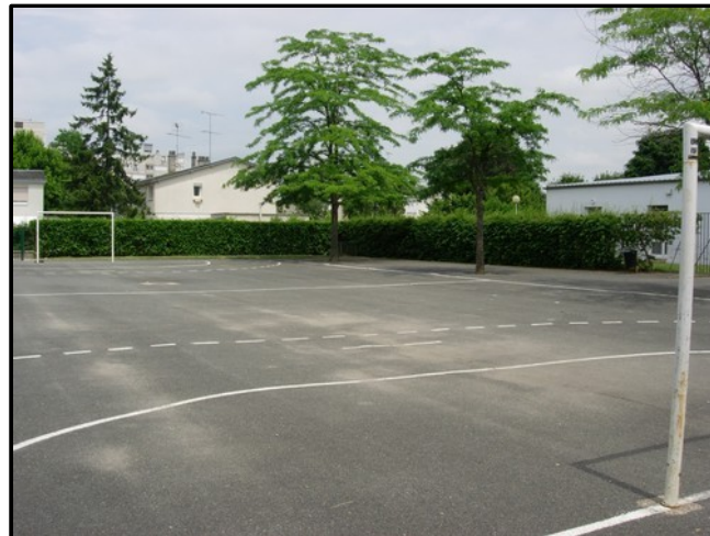
Cour de récréation