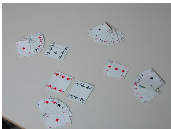
Association de 2 cartes de même couleur et de même valeur.

La partie s'arrête quand toutes les familles ont été regroupées et le perdant est celui qui conserve le « pouilleux ». Tous les autres sont considérés comme gagnants.